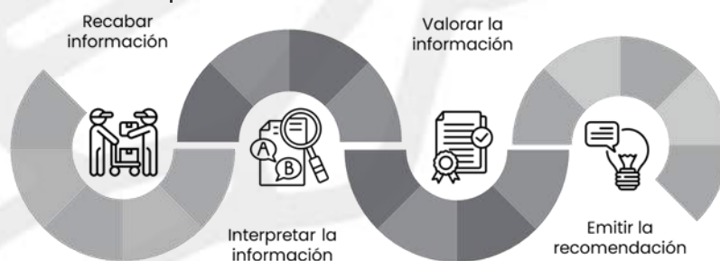
Ilustración 3. Trayectoria analítica para emitir una recomendación.